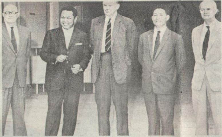
Anggota Suruhanjaya Cobbold yang ditubuhkan untuk memungut suara penduduk Sabah dan Sarawak.

Sabah terlebih dulu menyambut kemerdekaannya pada 31