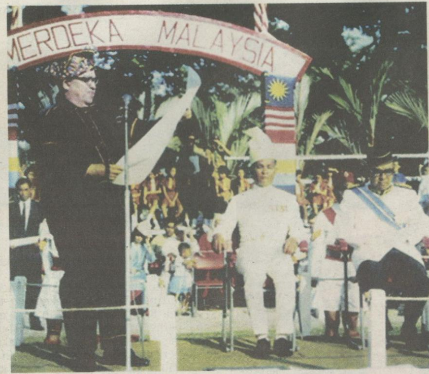
Tun Mohd Fuad Stephens membacakan Pengisytiharan Malaysia pada 16 September 1963.