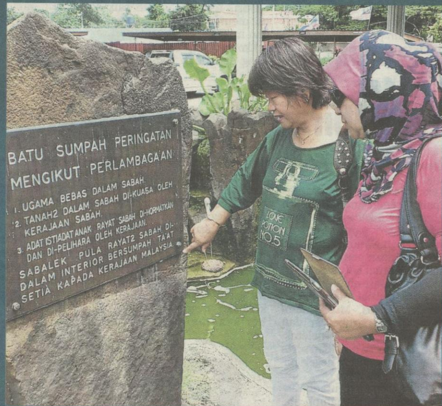
Dua penduduk di Keningau melihat Batu Sumpah Peringatan di pekarangan bangunan Majlis Daerah Keningau yang cukup simbolik dalam penubuhan Malaysia dan sikap menghormati diterapkan pemimpin Kerajaan Persekutuan terhadap permintaan penduduk tempatan.