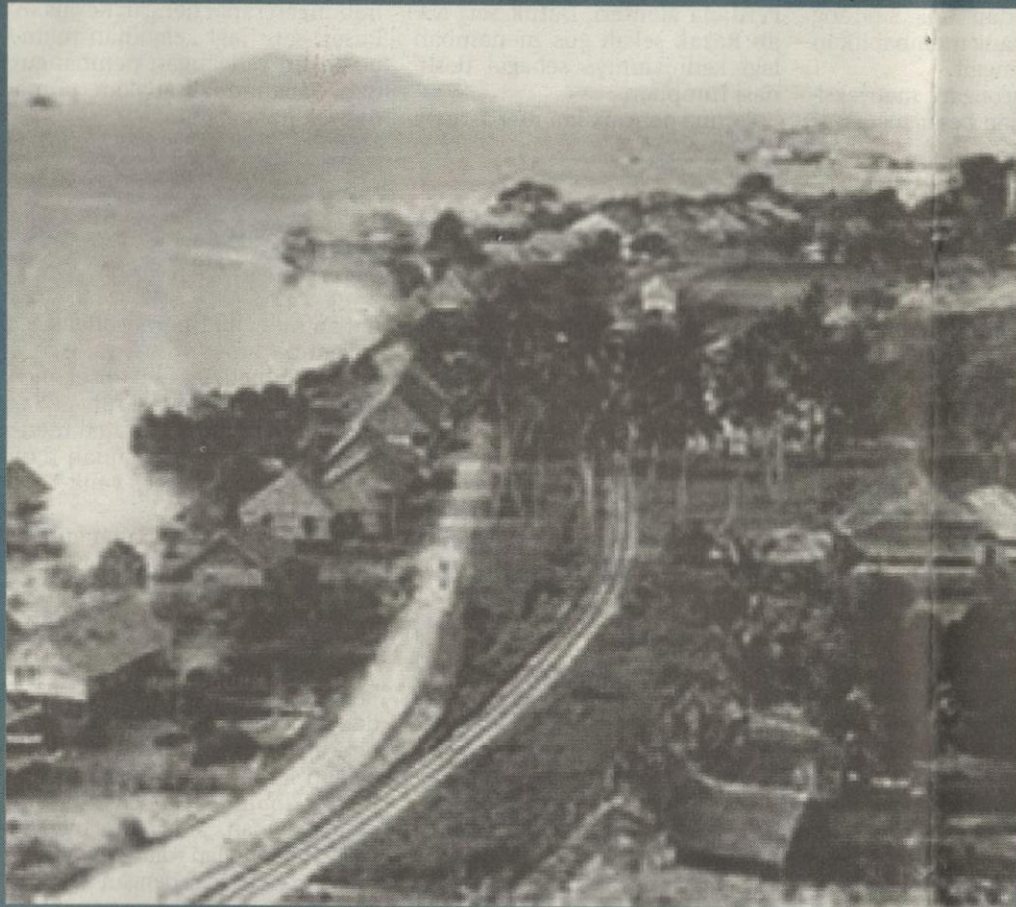
Bandar Jesselton lama.