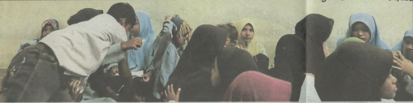
Etnik Rohingnya melarikan diri ke Malaysia untuk mendapat perlindungan daripada mangsa pembersihan etnik di Myanmar.