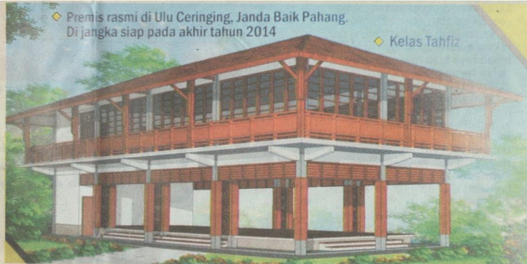
◆ Premis rasmi di Ulu Ceringing, Janda Baik Pahang. Di jangka siap pada akhir tahun 2014

“Dijangka dengan pembinaan premis baru, Matah boleh menampung seramai antara 250 dan 300 pelajar bermula daripada tingkatan satu sehingga lima. Untuk perancangan lima tahun seterusnya, kos penyelenggaraan dianggarkan sekitar RM10 juta,” kata beliau.