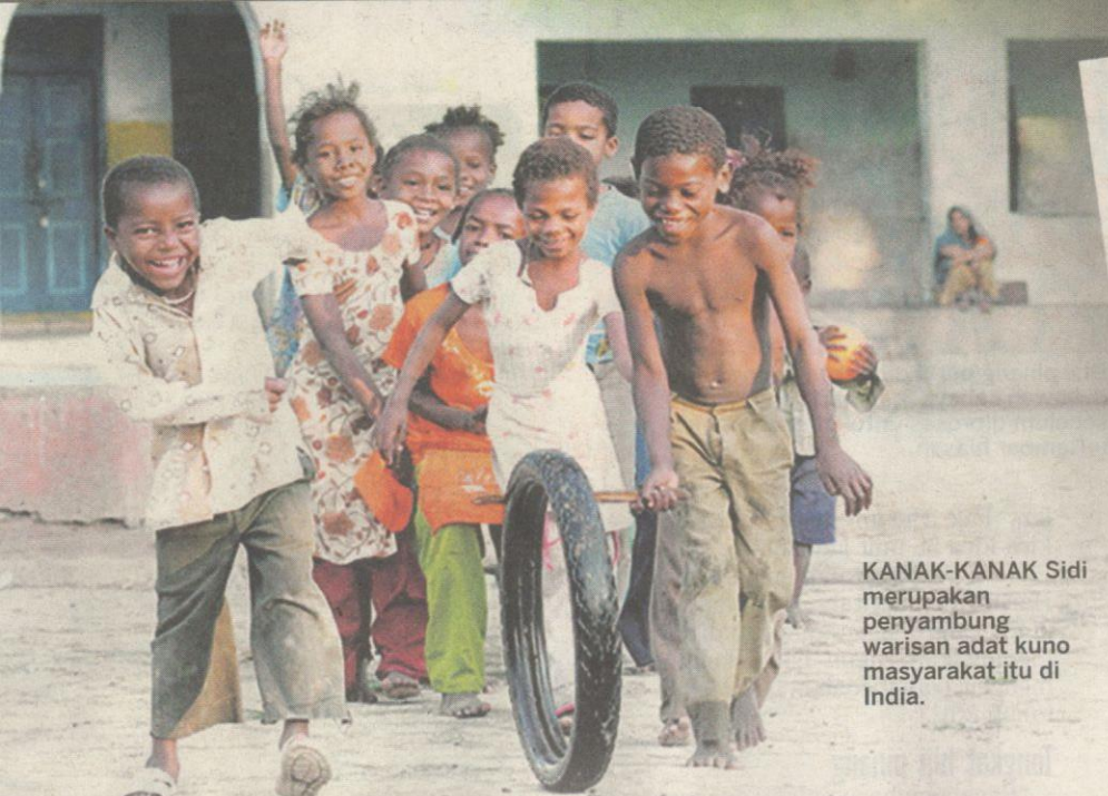
KANAK-KANAK Sidi merupakan penyambung warisan adat kuno masyarakat itu di India.