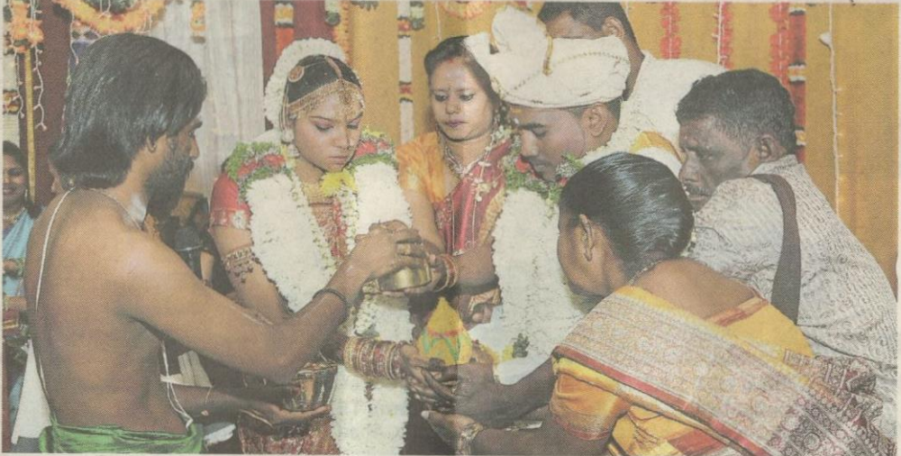
Majlis perkahwinan India kaya adat resam yang kekal diamalkan hingga hari ini.