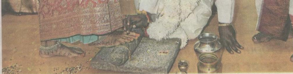
Antara adat majlis perkahwinan kaum India .

Menjelas lanjut, katanya adat ini dilakukan lima hari sebelum hari perkahwinan