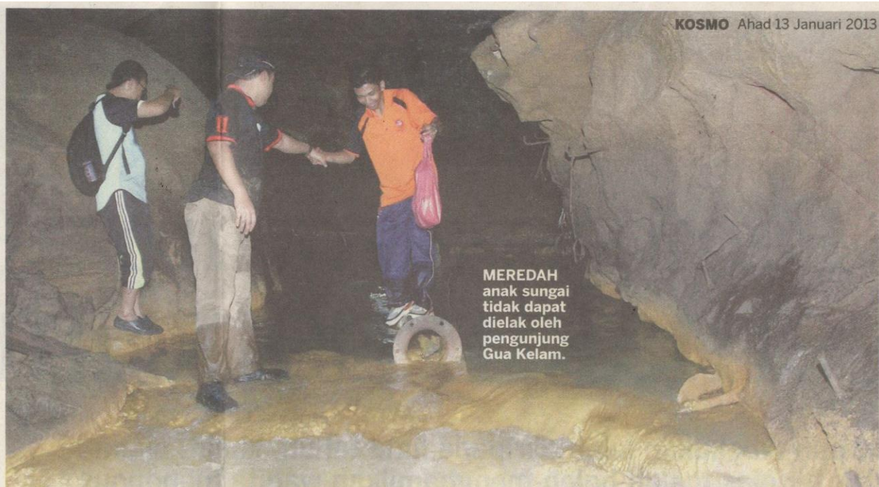
MEREDAH anak sungai tidak dapat dielak oleh pengunjung Gua Kelam.