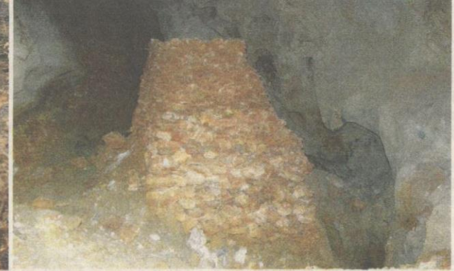
PIRAMID misteri dibina daripada batu-batu empat segi yang berkilauan.

temui seperti emas selain menjadi kubur pelombong yang tidak sempat dibawa keluar.