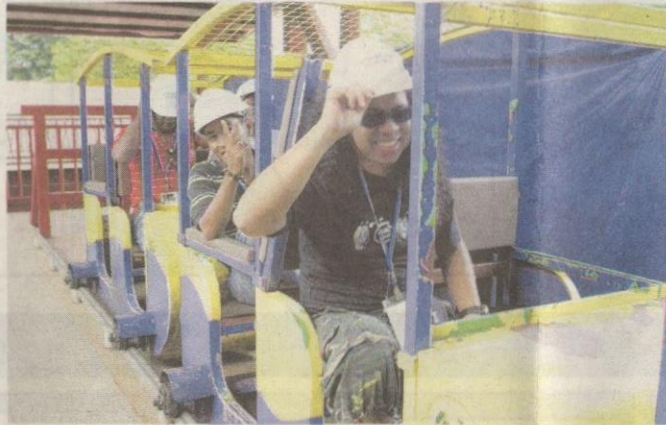
PERKHIDMATAN kereta api mini yang membawa pengunjung sejauh 400 meter ke dalam gua dihentikan sementara waktu.

Ekoran itu, katanya, usaha menjadikan Gua Kelayam sebagai destinasi utama pelancongan negeri Perlis dibuat secara berperingkat bermula tahun 2009 dengan