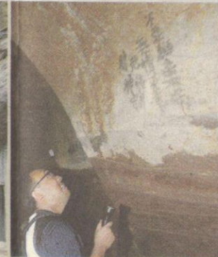
LUAHAN perasaan pelombong dalam tulisan Cina.