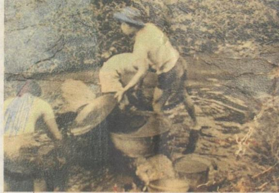
SUASANA aktiviti melombong bijih timah di dalam Gua Kelam kira-kira 30 tahun lalu.

Monumen tersebut adalah penemuan terbaharu