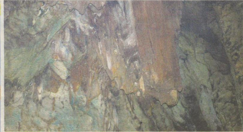
TIRAI gua terbentuk daripada celahan batu yang mengeluarkan air.

"Bagaimanapun, pelancong masih boleh memasuki Gua Kelayam 2 dengan mendapatkan kebenaran daripada pihak pe-