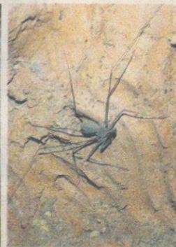
LABAH-LABAH gua sering ditemui di sini.