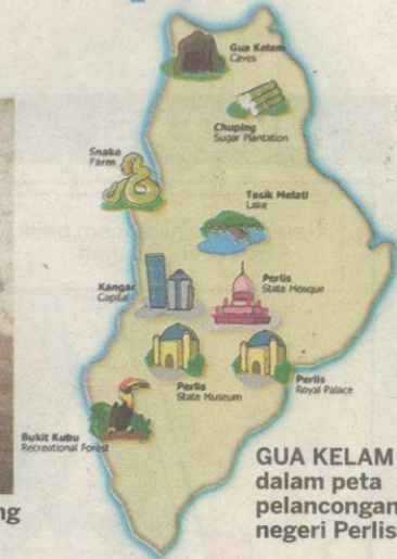
GUA KELAM dalam peta pelancongan negeri Perlis.