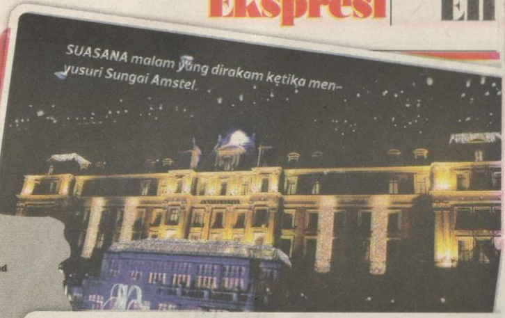
SUASANA malam yang dirakam ketika menyusuri Sungai Amstel.