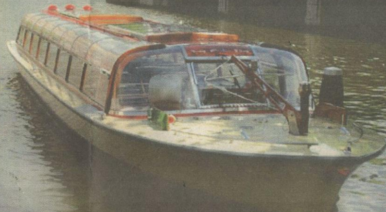
TERUSAN dibina di sekeliling bandar Amsterdam.