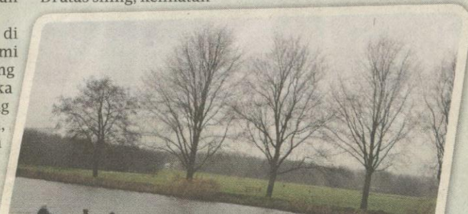
Lokasi pertama kami kunjungi ialah