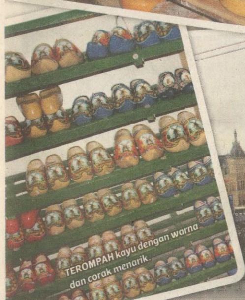
TEROMPAH kayu dengan warna dan corak menarik.