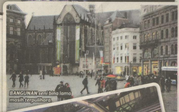
BANGUNAN seni bina lama masih terpulihara.

masyarakat Pakistan terletak di antara deretan bangunan tiga tingkat. Di tingkat bawah, kelihatan jemaah lelaki menunaikan solat berjemaah manakala tingkat satu adalah tempat kanak-kanak belajar agama.