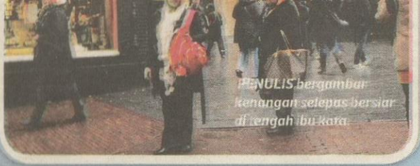
PENULIS bergambar kenangan selepas bersiar di tengah ibu kota.