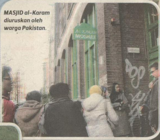
MASJID al-Karam diuruskan oleh warga Pakistan.