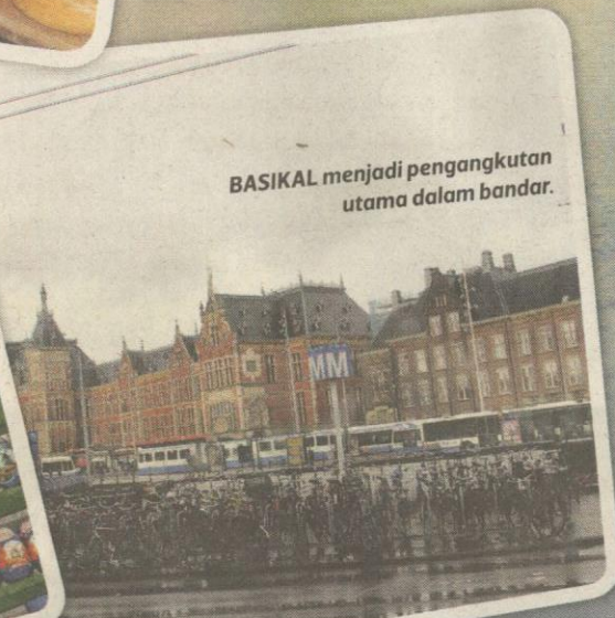
BASIKAL menjadi pengangkutan utama dalam bandar.