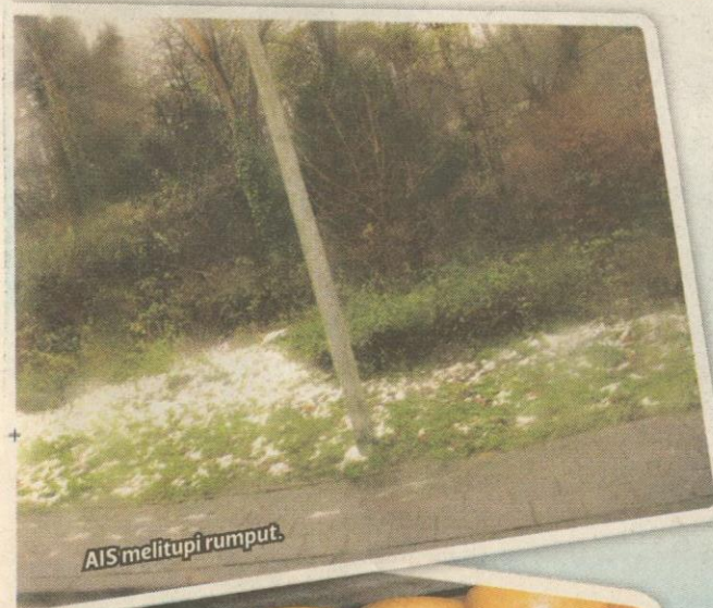
AIS melitupi rumput.

Kami berhenti di Masjid al-Karam di tengah kota Amsterdam untuk menunaikan solat Zuhur. Al-Karam yang diuruskan