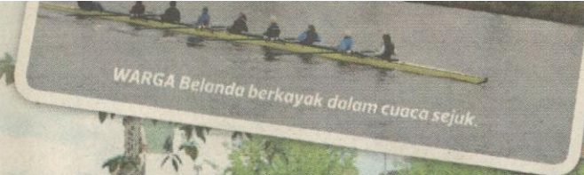
WARGA Belanda berkayak dalam cuaca sejuk.