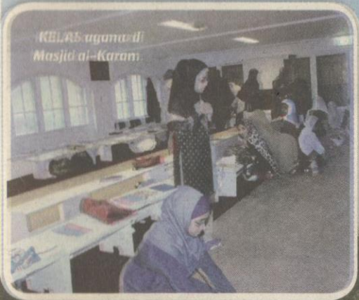
KELAS agama di Masjid al-Karam.