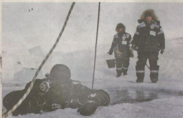
SEORANG penduduk mencuba untuk menyelam di dalam Tasik Labyntyr di Oymyakon.

SEORANG wanita berjalan di sebuah jambatan yang diliputi ais di Oymyakon.