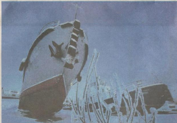
OYMYAKON mempunyai kepadatan penduduk seramai 500 orang sahaja.