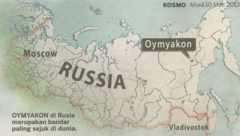
OYMYAKON di Rusia merupakan bandar paling sejuk di dunia.