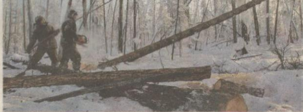
TIADA tumbuh-tumbuhan yang hidup di bandar ini.

Oymyakon, yang bererti 'air yang tidak pernah membeku' dan ia merujuk kepada sebuah sumber air panas yang terletak tidak jauh dari lokasi bandar tersebut