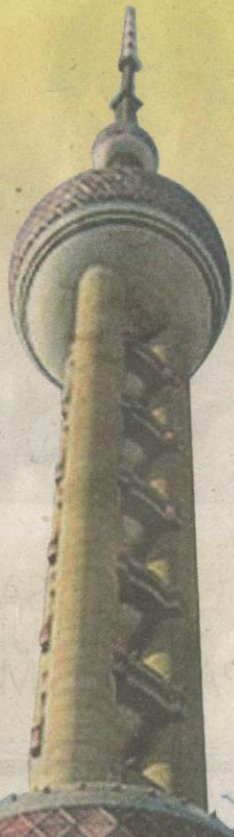
Canggih. Oriental Pearl TV Tower.