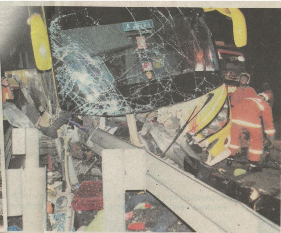
Kedadaan bas ekspres yang terbabit dalam kemalangan di Kilometer 402 Lebu Raya Utara Selatan awal pagi semalam.