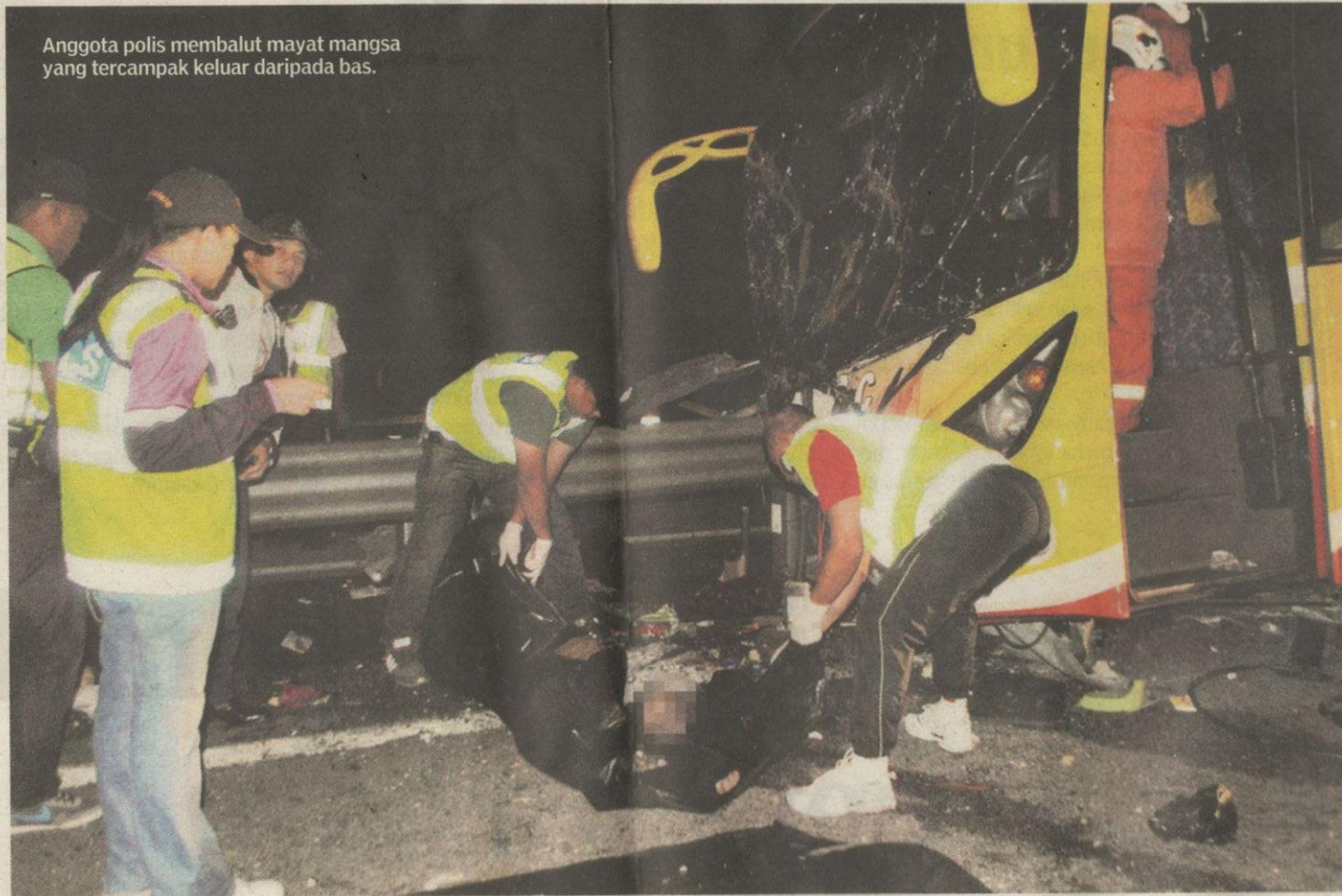
Anggota polis membalut mayat mangsa yang tercampak keluar daripada bas.

"Sepatutnya, perjalanan kami ke Sungai Nibong hanya menaiki satu bas tetapi kami diarahkan menaiki bas lain ketika tiba di