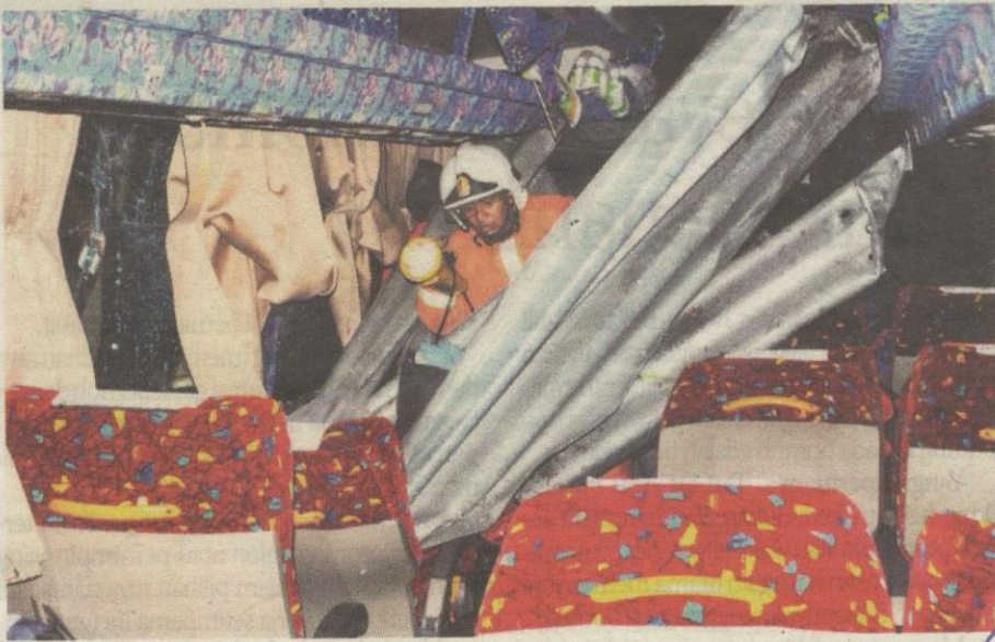
Seorang anggota bomba melihat keadaan dalam bas untuk mencari kaedah mengeluarkan mangsa yang tersepit.

Dia yang baru sampai ke Malaysia bersyukur kerana terselamat daripada kemalangan tersebut.