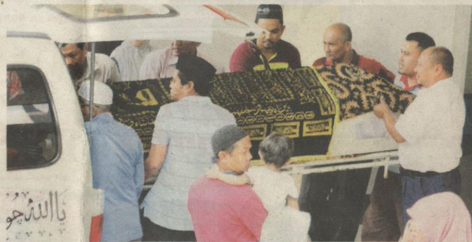
Kakitangan Hospital Kuala Kubu Bharu membantu keluarga mangsa mengusung jenazah yang terlibat dalam kemalangan.