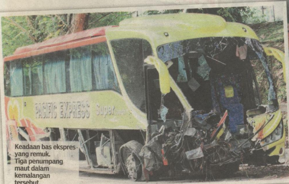
Kedadaan bas ekspres yang remuk. Tiga penumpang maut dalam kemalangan tersebut.

"Kedua-dua mangsa ini duduk berdekatan iaitu depan dan belakang," katanya.