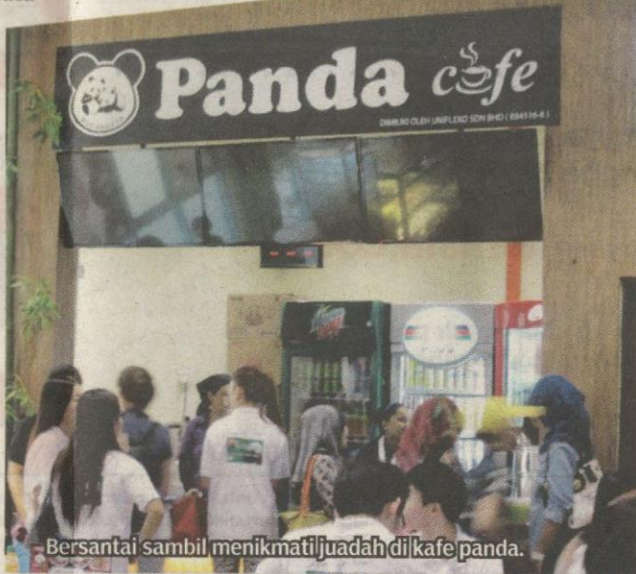
Bersantai sambil menikmati juadah di kafe panda.