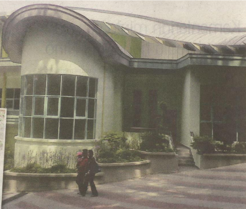
Inilah kediaman baharu pasangan panda yang dibina khas.