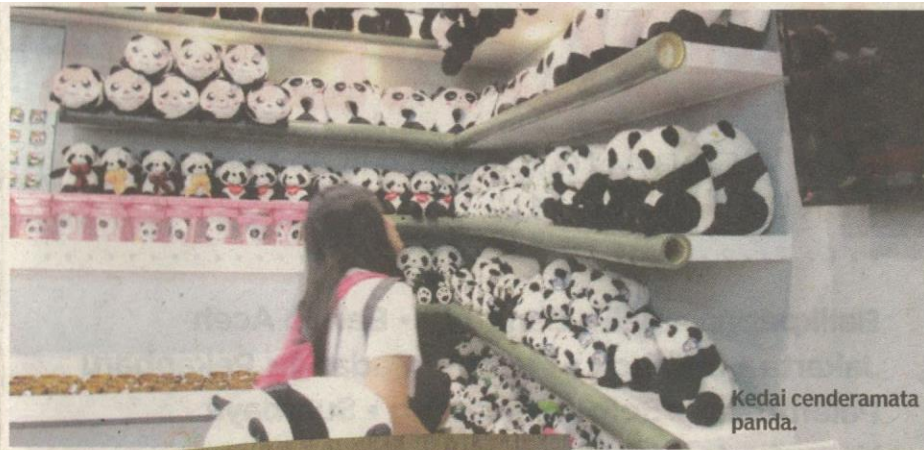
Kedai cenderamata panda.

Ayuh jangan lepaskan peluang melihat mamalia comel ini dan pada masa sama pujian harus diberi kepada pihak pengurusan zoo yang nampaknya cekap menguruskan haiwan penuh makna ini.