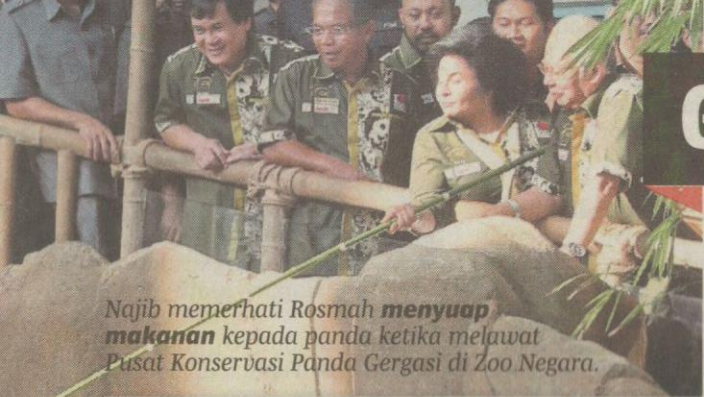
Najib memerhati Rosmah menyuap makanan kepada panda ketika melawat Pusat Konservasi Panda Gergasi di Zoo Negara.