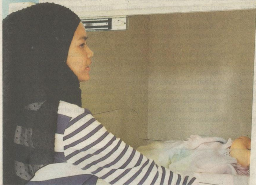
Demonstrasi 3: Pintu perlu ditutup sebaik bayi ditinggalkan. Pintu tidak boleh dibuka dari luar melainkan oleh penjaga pusat berkenaan.