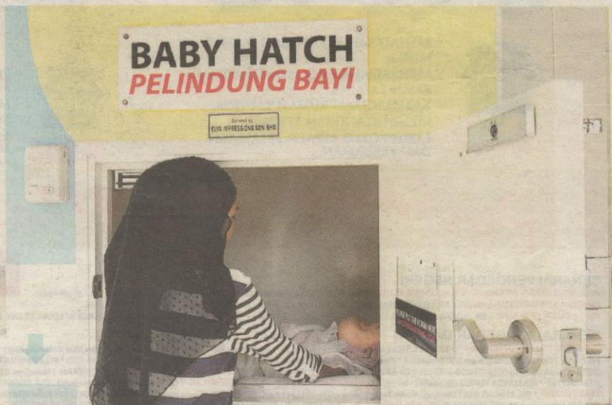
Demonstrasi 2: Sebaik bayi diletakkan, secara automatik lampu akan terpasang.