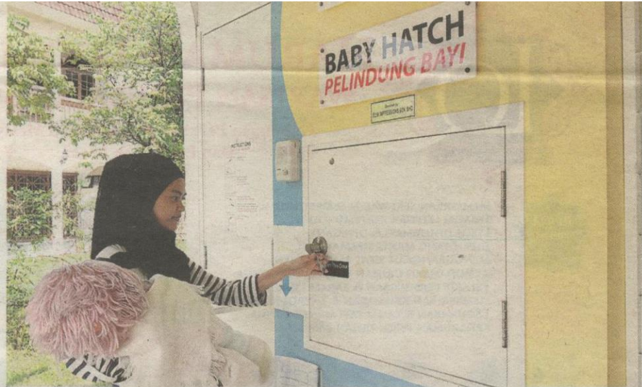
Demonstrasi 1: Pintu baby hatch sedia untuk dibuka.