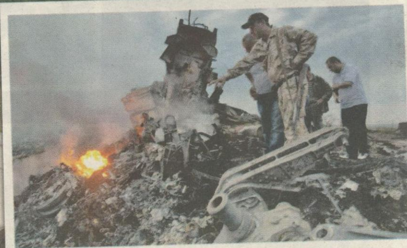
Serpihan pesawat MH17 Terbakar