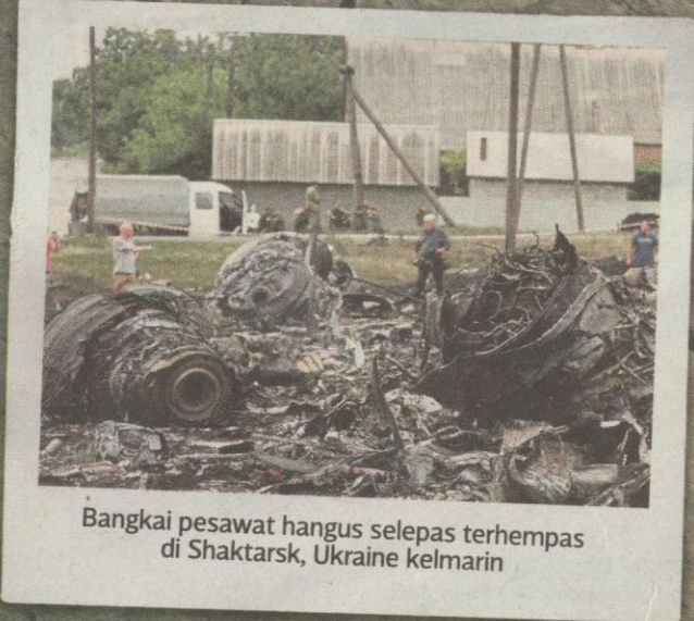
Bangkai pesawat hangus selepas terhempas di Shkatsk, Ukraine kelmarin