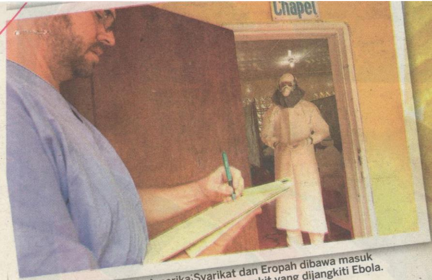
PETUGAS perubatan dari Amerika Syarikat dan Eropah dibawa masuk ke Liberia untuk membantu merawat para pesakit yang dijangkiti Ebola.

SEORANG wanita dirawat di klinik khas di Monrovia, Liberia selepas menunjukkan gejala jangkitan yang kritikal.