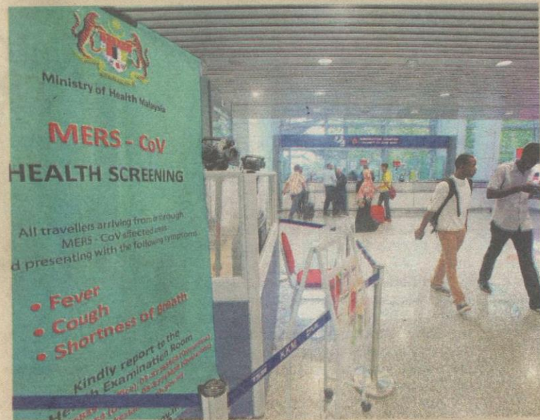
KEMENTERIAN Kesihatan menggalakkan orang ramai melakukan pemeriksaan kesihatan termasuk ketika isu MERS-CoV beberapa bulan lalu.

"Langkah penting untuk tidak dijangkiti penyakit atau wabak maut ialah menjaga kesihatan dan segera melakukan pemeriksaan apabila berasa tidak sihat," katanya.