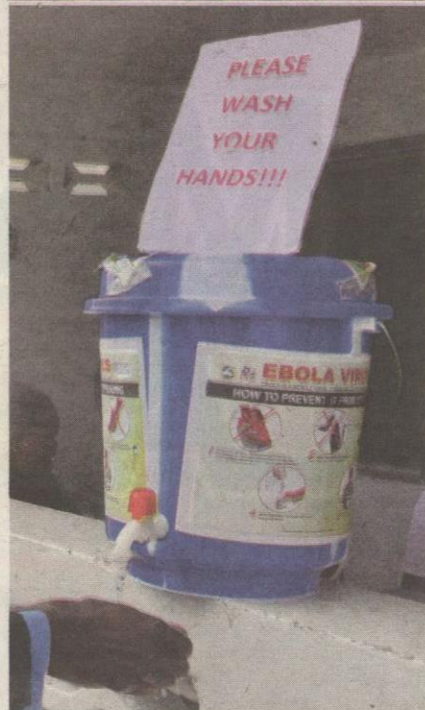
KIRI: Bekas berisi air untuk mencuci tangan yang ditampal risalah mengenai cara Ebola berjangkit diletakkan di tempat awam di sekitar Monrovia.

wan lain memberitahu, peningkatan bilangan kematian akibat wabak Ebola didorong oleh kelemahan orang ramai yang tidak mempunyai cukup maklumat mengenai penyakit maut tersebut.