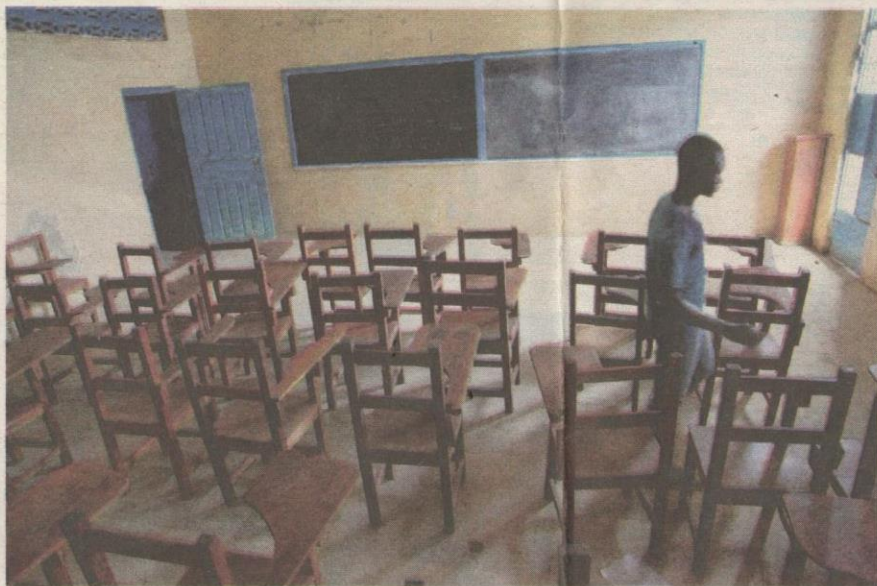
SEBUAH sekolah di Monrovia ditutup apabila penularan wabak Ebola bertukar serius sejak beberapa bulan lalu.