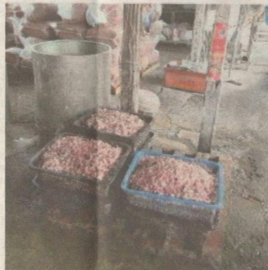
KEADAAN lantai sebuah kilang memproses bawang di Pulau Pinang yang kotor.