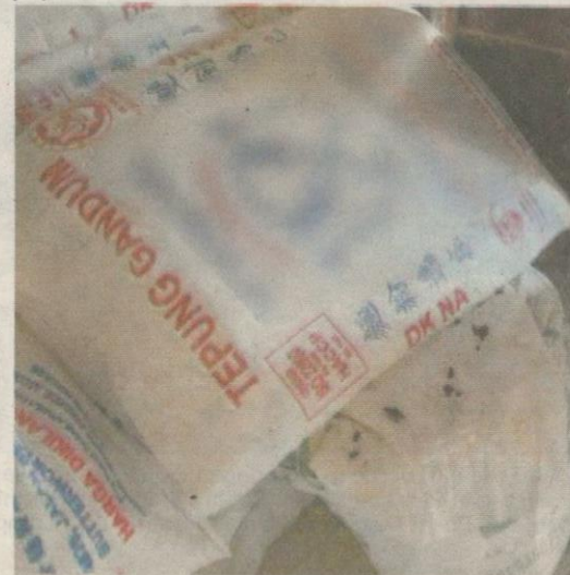
TAHI tikus ditemui melekat pada guni gandum di sebuah kilang di Pulau Pinang.