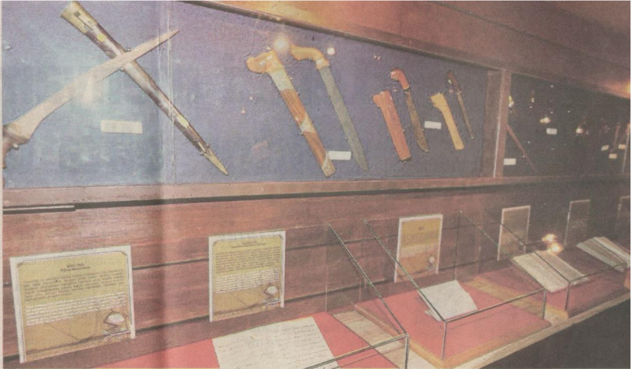
Koleksi senjata antara yang dipamerkan di pameran Antarabangsa Manuskrip Melayu di Perpustakaan Negara.