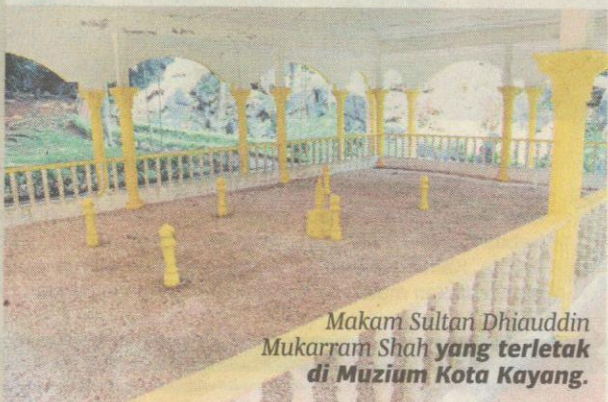
Makam Sultan Dhiauddin Mukarram Shah yang terletak di Muzium Kota Kayang.