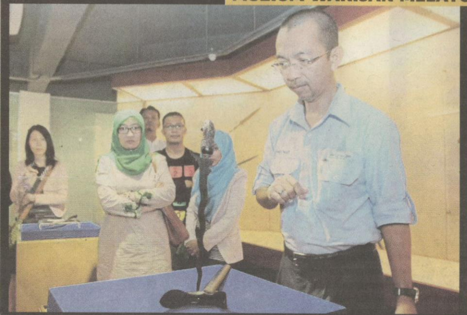
Keris berdiri dipamerkan pada segmen Senjata Warisan Melayu.