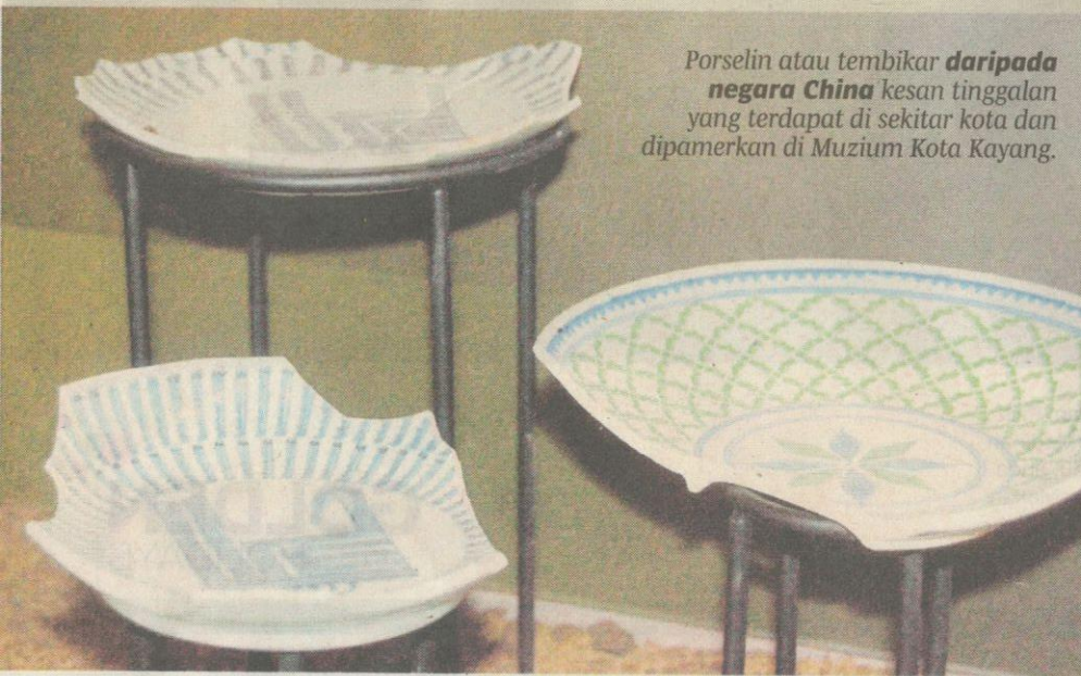
Porselin atau tembikar daripada negara China kesan tinggalan yang terdapat di sekitar kota dan dipamerkan di Muzium Kota Kayang.