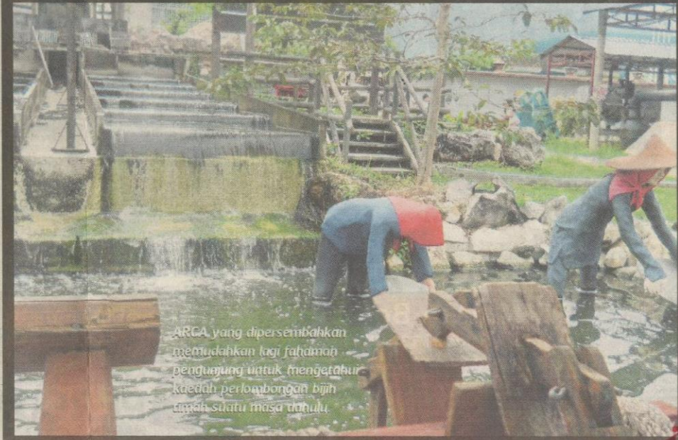
ARCA yang dipersembahkan memudahkan lagi fahaman pengunjung untuk mengetahui kaedah perlombongan bijih timah suatu masa dahulu.