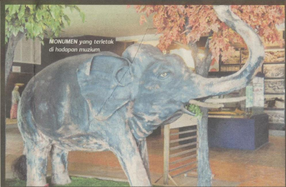
MONUMEN yang terletak di hadapan muzium.

Pengunjung yang masuk akan didedahkan kaedah aktiviti mendulang, pam kelikir dan pertunjukan pelbagai peralatan perlombongan yang berada di luar dan dalam bangunan muzium.