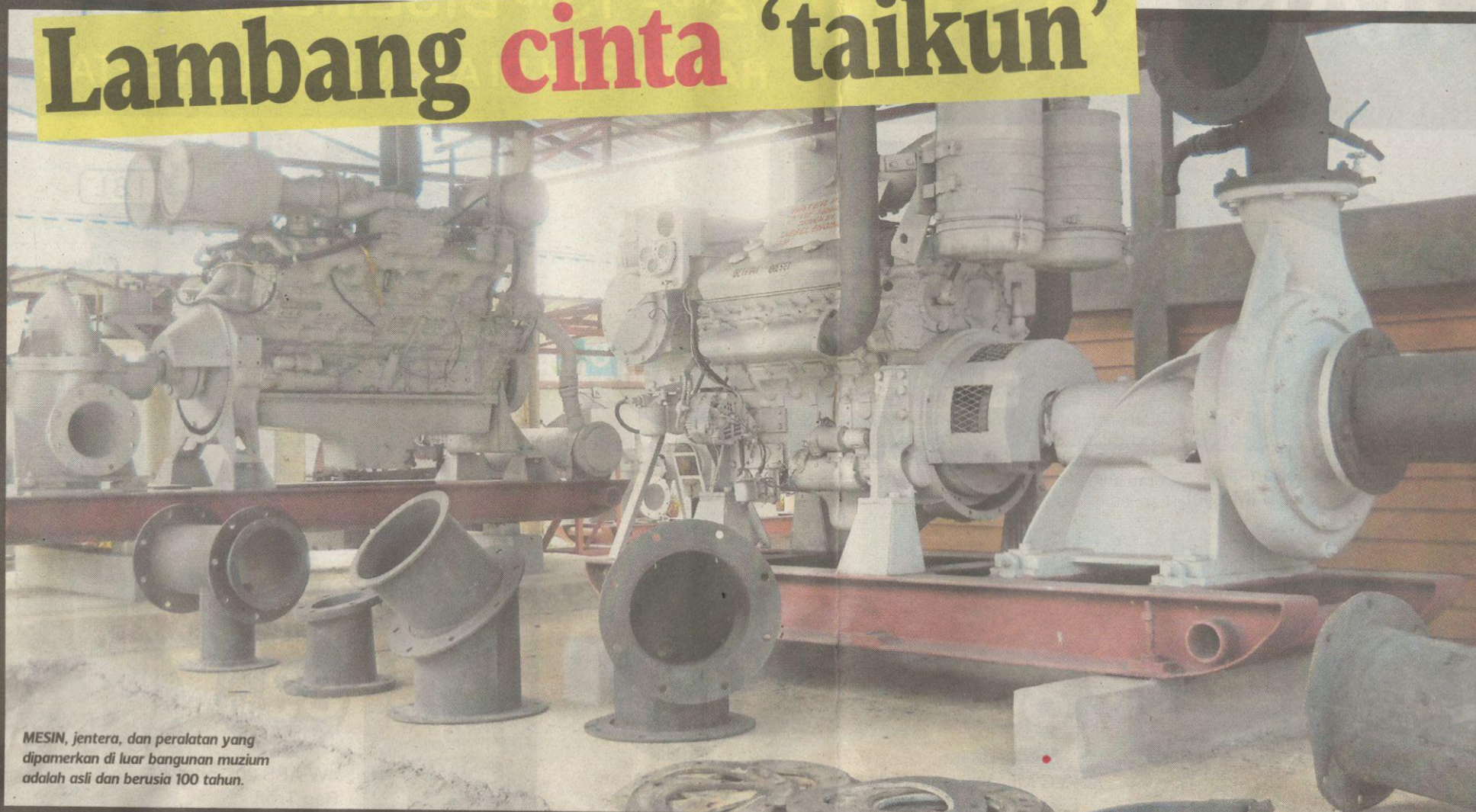
MESIN, jentera, dan peralatan yang dipamerkan di luar bangunan muzium adalah asli dan berusia 100 tahun.