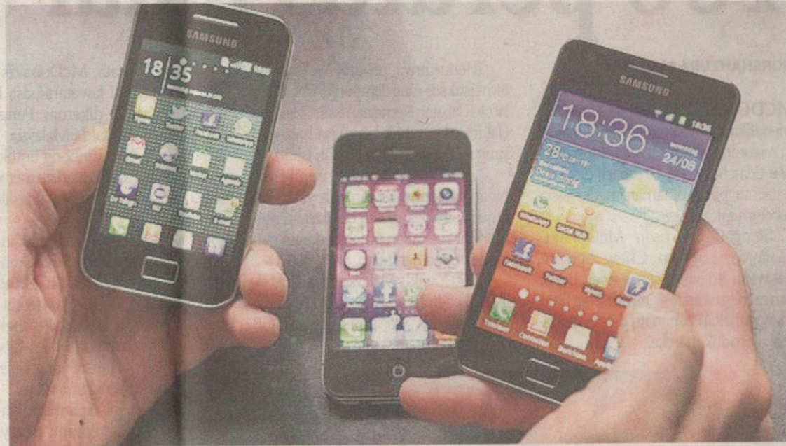
Rakyat Malaysia meluangkan lebih banyak masa melayari internet dan media sosial di telefon pintar.

ILUSTRASI: SINAR HARIAN OLEH: AIMA HASHIM