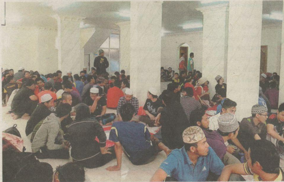
Beginilah keadaan pelajar Malaysia yang ditempatkan di lokasi sementara yang disediakan oleh Kedutaan Malaysia di Sana'a.

Dalam masa sama, Syed Husain turut mengucapkan tahniah kepada Persatuan Pelajar Malaysia Yaman (Permaya) kerana bertungkus-lumus memastikan keadaan pelajar di sana selamat.