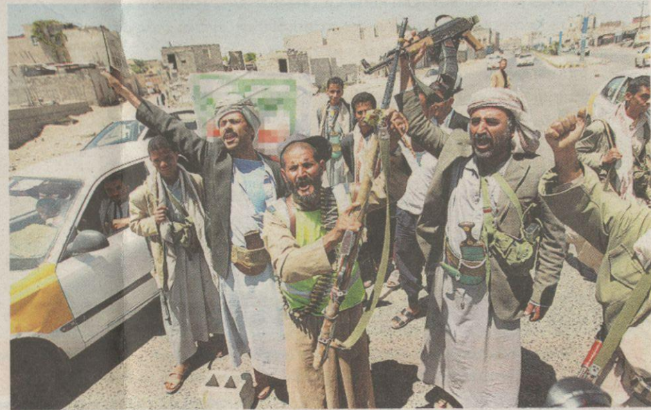
Tentera anti kerajaan melaungkan ungkapan protes terhadap pimpinan negara itu selepas berjaya menawan pusat pemeriksaan di utara wilayah Sana'a, kelmarin.