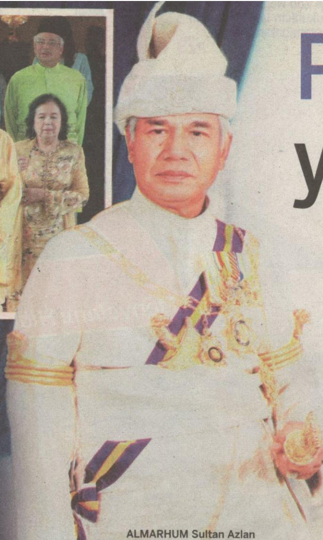
ALMARHUM Sultan Azlan Shah berperawakan peramah dan disenangi rakyat jelata.