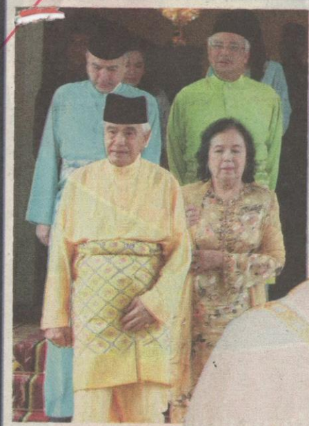
ALMARHUM Sultan Azlan Shah dan Raja Permaisuri Perak, Tuanku Bainun berangkat meninggalkan Istana Iskandariah selepas Majlis Angkat Sumpah Menteri Besar Perak, Datuk Dr. Zambry Abdul Kadir pada 6 Februari 2009.

Sewaktu menuntut di Maktub Melayu Kuala Kangsar, Almarhum mengikuti