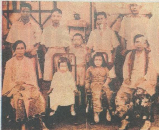
ALMARHUM Sultan Azlan Shah (berdiri dua dari kanan) dibesarkan dalam persekitaran orang kebanyakan.

← Tidak sampai setahun berkhidmat di Pejabat Setiausaha Kerajaan Negeri, Almarhum memilih untuk memasuki bidang perkhidmatan yang menepati kelulusan akademiknya iaitu bidang perundangan dan kehakiman.