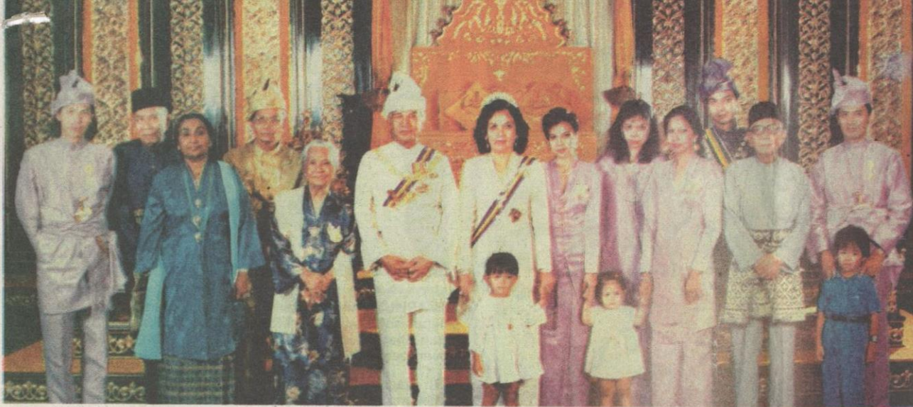
ALMARHUM Sultan Azlan Shah bergambar bersama keluarga semasa istiadat mengangkat sumpah sebagai Paduka Seri Sultan Perak yang ke-34 pada 31 Januari 1984.