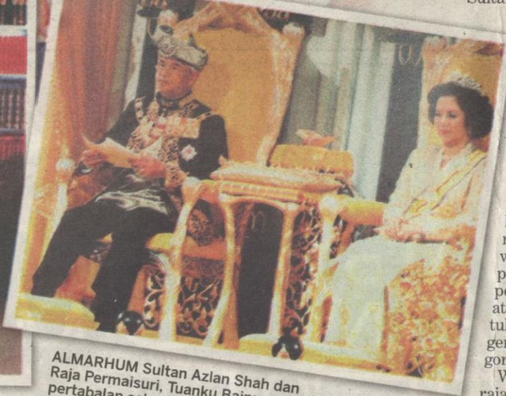
ALMARHUM Sultan Azlan Shah dan Raja Permaisuri, Tuanku Bainun semasa pertabalan sebagai Yang di-Pertuan Agong pada tahun 28 April 1989.