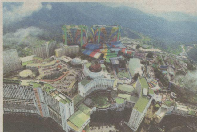
KOTA Keriangan Genting Highlands antara destinasi percutian tanah tinggi yang menarik dikunjungi.

ban dengan menggunakan besi keluli menghubungkan Gunung Mat Chincang dan sebuah gunung lain yang bersebelahan dengannya.