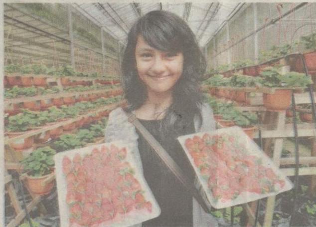
PENGALAMAN memetik stawberi segar pasti mengujakan.