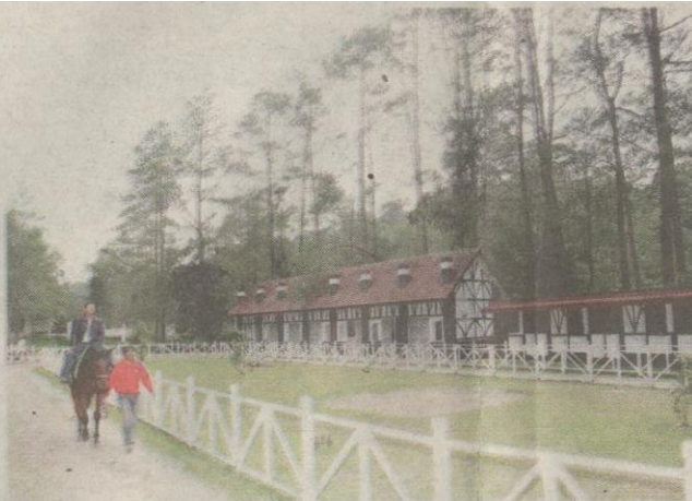
MENUNGGANG kuda juga antara yang menanti di Bukit Fraser.