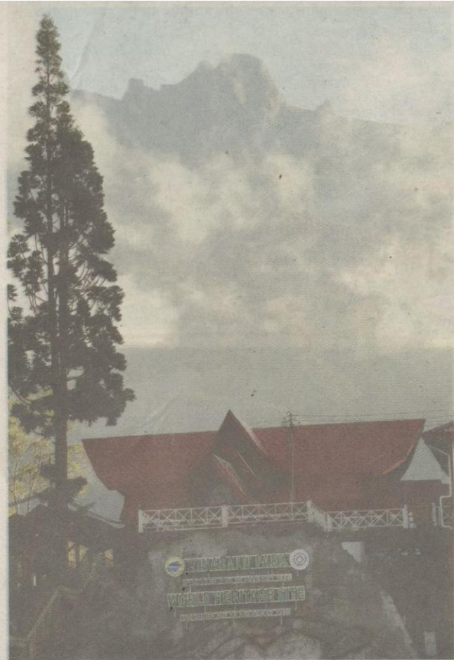
PEMANDANGAN mempesona di Taman Negara Kinabalu menggamit pengunjung.