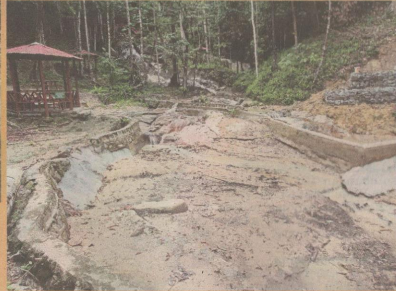
Kemudahan yang tidak diselenggara di Hutan Lipur Lenggeng, Seremban.