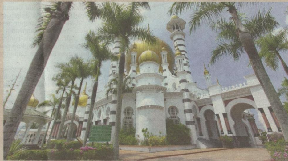
MASJID Ubudiah di Bukit Chandan merupakan ikon kebanggaan umat Islam di bandar diraja Kuala Kangsar.

Melalui risalah yang mula diperkenalkan pada tahun 2011 itu, pelancong mendapat panduan perjalanan percutian mereka sepanjang bercuti di Kuala Kangsar.