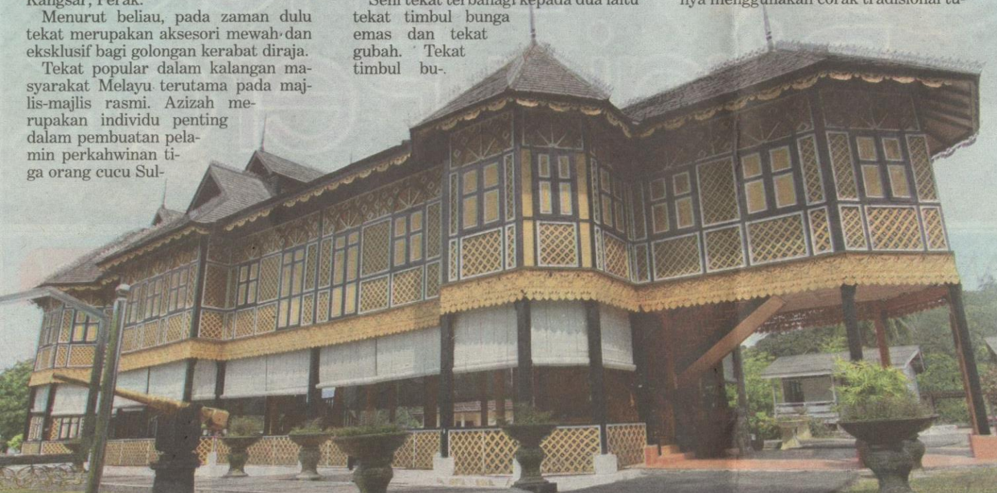
ISTANA Kenangan atau Muzium Diraja Perak kini dalam proses penyelenggaraan dan dijadualkan dibuka dalam masa terdekat.

Keluasan kawasan pentadbiran daerah Kuala Kangsar me-