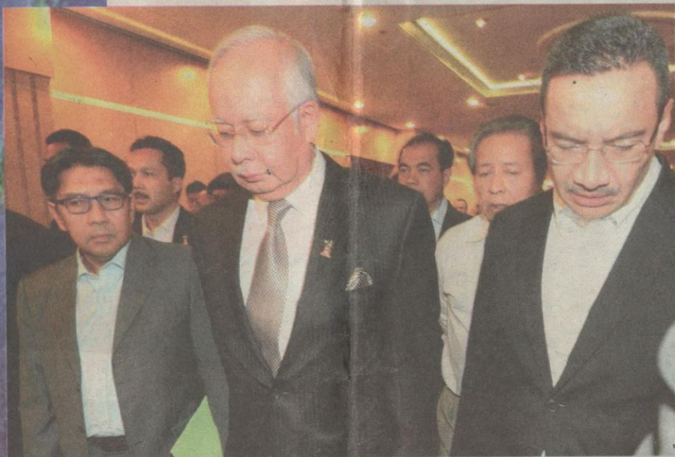
DATUK Seri Najib Tun Razak kelihatan sugul selepas mengesahkan MH370 dikesan di Lautan Hindi.