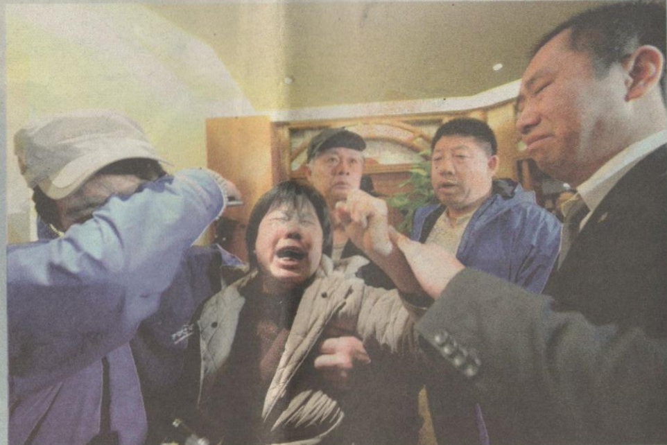
SEORANG ibu kepada salah seorang penumpang MH370 dari China meraung selepas dimaklumkan pesawat MH370 dikesan di Lautan Hindi.