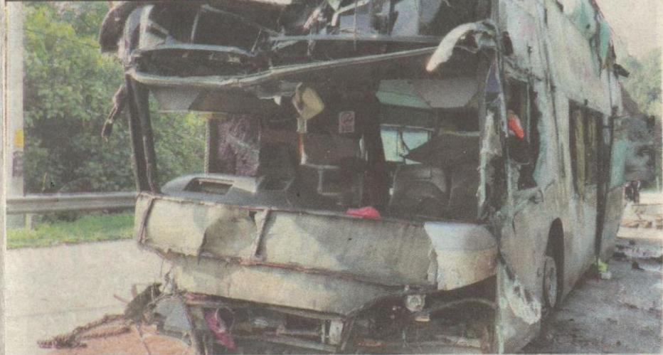
Keadaan bas yang remuk setelah terbabit nahas. Gambar kecil Saeed Mohamad dan Zarifah.