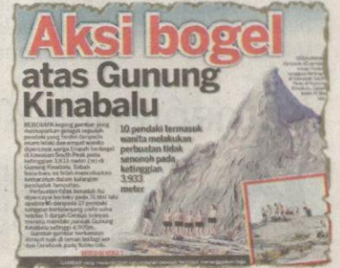
KERATAN Kosmo! 3 Jun 2015.

Sepanjang prosiding terbabit, kesemua tertuduh kelihatan tenang dalam menghadapi pertuduhan yang dibacakan oleh ju-