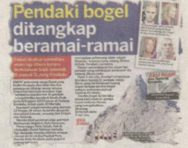
KERATAN Kosmo! 11 Jun 2015.

rubahasa mahkamah. Keempat-empat tertuduh tiba di pekarangan bangunan mahkamah tepat pukul 2.44 petang dengan menaiki dua kenderaan dengan dikawal rapi oleh anggota polis.