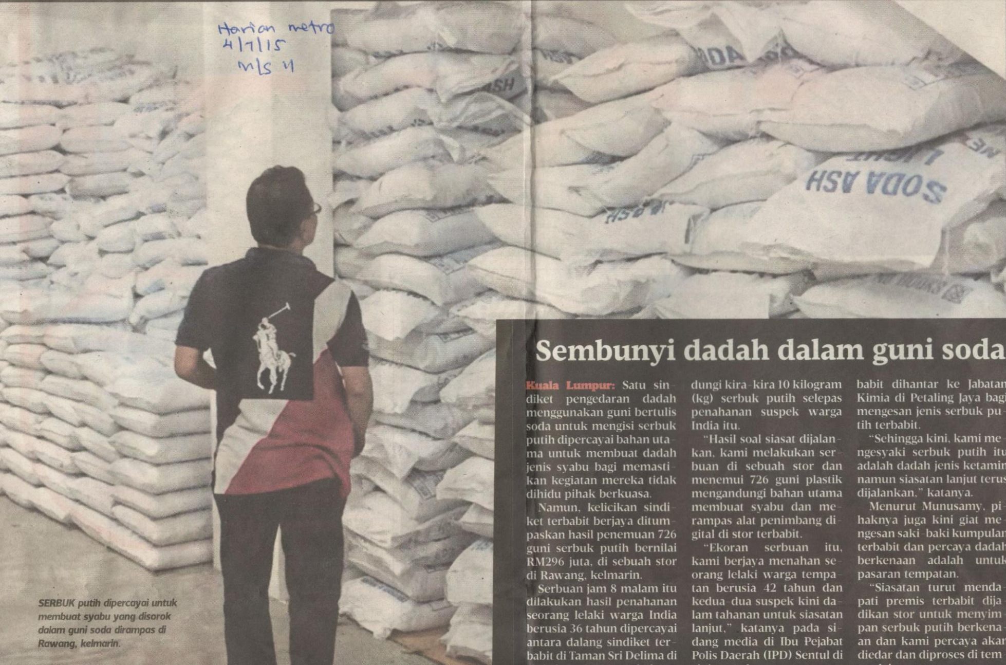
SERBUK putih dipercayai untuk membuat syabu yang disorok dalam guni soda dirampas di Rawang, kelmarin.