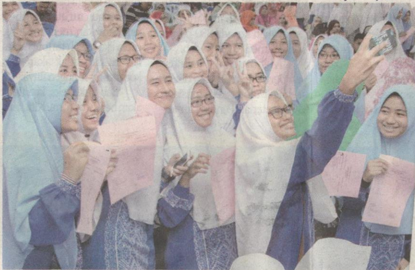
Pelajar Sekolah Menengah Kebangsaan Agama Naim Lilbanat, Kota Bharu berselfie bersama selepas menerima keputusan PT3.