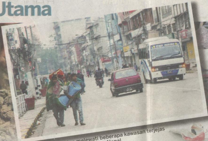
PENDUDUK tempatan melewati beberapa kawasan terjejas selepas gempa bumi di Bhaktapur, Nepal.

SEORANG penduduk membersihkan runtuhannya rumahnya akibat gempa bumi di Nepal baru-baru ini.