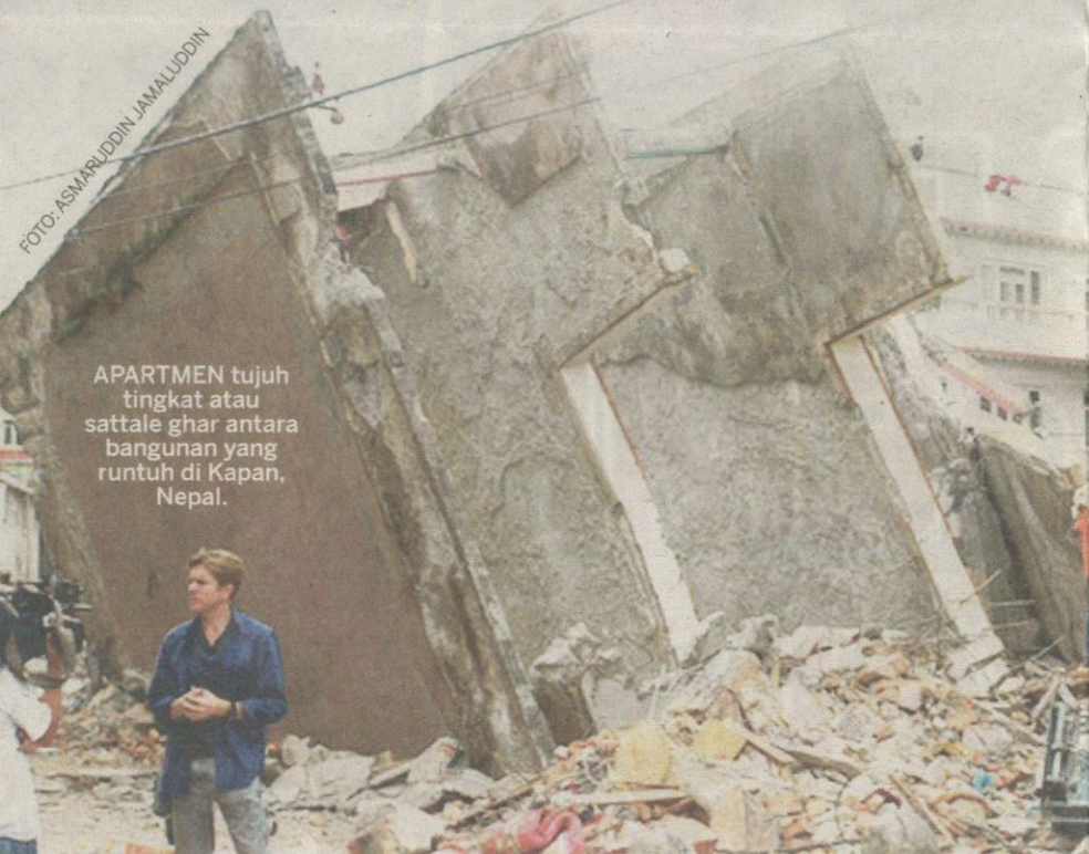
APARTMEN tujuh tingkat atau sattale ghar antara bangunan yang runtuh di Kapan, Nepal.