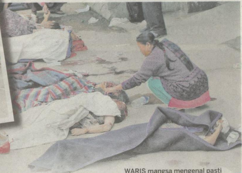
WARIS mangsa mengenal pasti ahli keluarga mereka yang terkorban akibat gempa bumi.