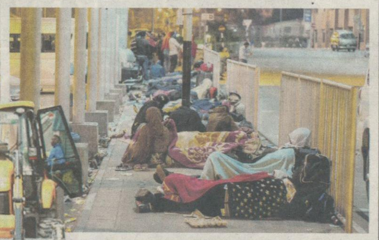
ORANG ramai bermalam di kaki lima Lapangan Terbang Antarabangsa Tribhuvan Kathmandu, Nepal.