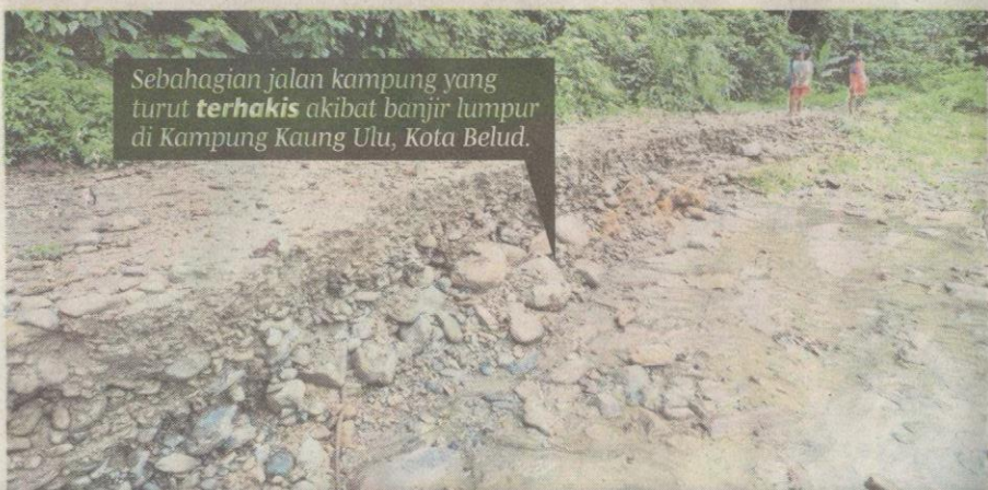
Sebahagian jalan kampung yang turut terhakis akibat banjir lumpur di Kampung Kaung Ulu, Kota Belud.