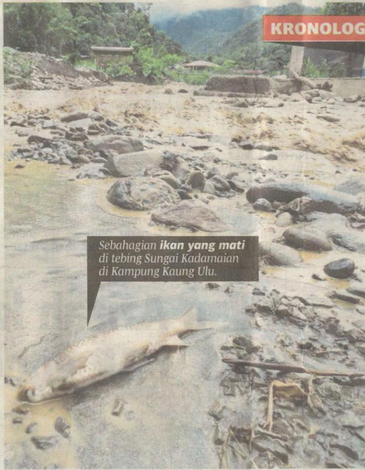
Sebahagian ikan yang mati di tebing Sungai Kadamaian di Kampung Kaung Ulu.