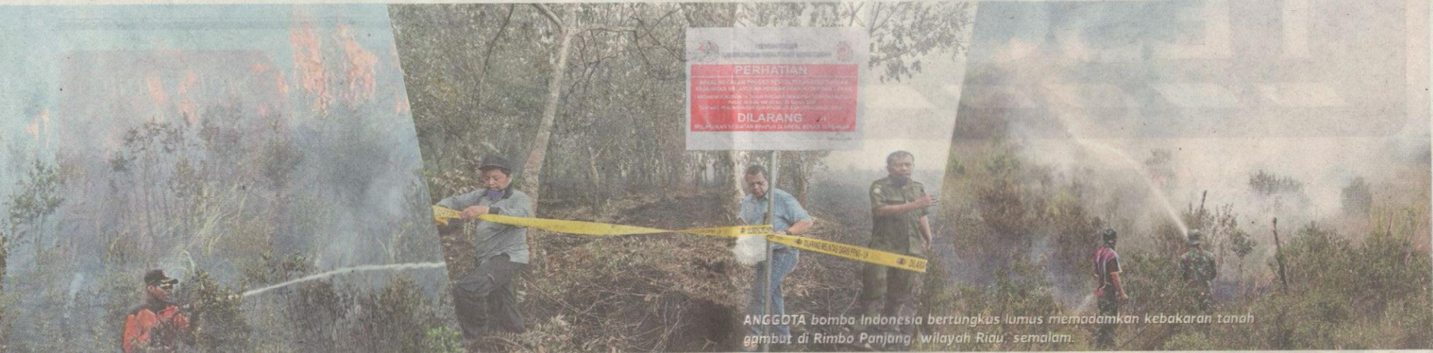
ANGGOTA bomba Indonesia bertungkus lumus memadamkan kebakaran tanah gambut di Rimbo Panjang, wilayah Riau, semalam.