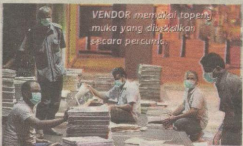
VENDOR memakai topeng muka yang dibekalkan secara percuma.

“Usaha ini juga sebagai tanggungjawab kami bagi memastikan langkah pencegahan diberikan kepada pembekal sejajar dengan saranan Kementerian Kesihatan kepada orang ramai supaya memakai topeng ketika berada di luar pada musim jerebu ini,” katanya.