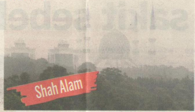
MASJID Sultan Salahuddin Abdul Aziz Shah dan bangunan Menara Majlis Agama Islam Selangor (kiri) di Shah Alam hampir hilang 'ditelan' jerebu teruk dengan bacaan IPU 112 setakat pukul 1.00 petang semalam.