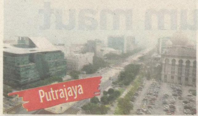
BANGUNAN kerajaan termasuk Istana Kehakiman (kanan) di Putrajaya diselubungi jerebu dengan bacaan IPU 111 setakat pukul 11 pagi semalam.