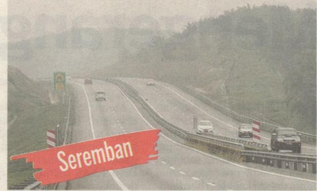
KENDERAAN melalui Lebuhraya Seremban - Port Dickson Sembilan semalam dalam keadaan jarak penglihatan yang terhad akibat jerebu.

Saran kerajaan naik taraf penapis partikel udara 2.5 mikrometer