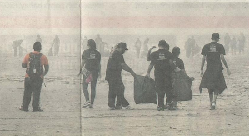
KAKITANGAN Prudential Bank Simpanan Nasional (BSN) Takaful memungut sampah di sepanjang pantai di Batu Hitam hingga ke pantai Awana Kijal Kemaman, Terengganu semalam walaupun dalam keadaan berjerebu teruk.