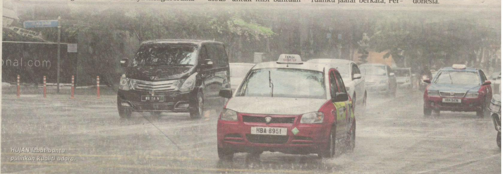
HUJAN lebat bantu pulihkan kualiti udara.

Katanya, air dijatuhkan di kawasan sasaran yang ditentukan pihak berkuasa Indonesia.