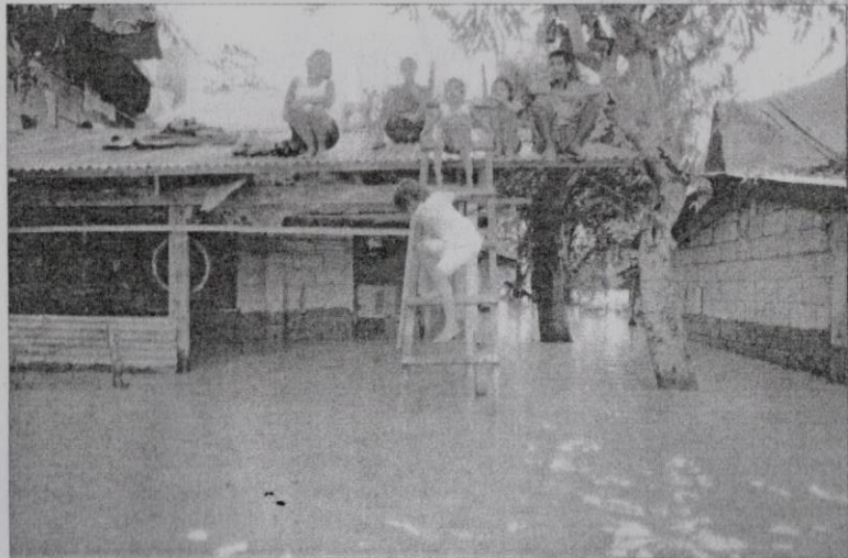
BUMBUNG rumah turut dijadikan tempat menyelamatkan diri sementara menunggu bantuan tiba.