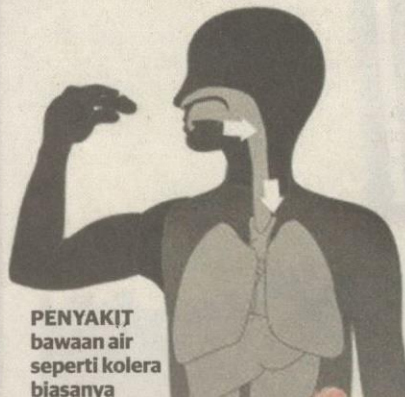
PENYAKIT bawaan air seperti kolera biasanya

Antara simptom yang biasanya dihidapi oleh pesakit ialah sakit perut yang teruk dan adakalanya kejang, cirit-birit dan