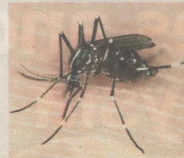
AEDES dikesan turut membawa virus

Bagaimanapun, Herawati memberitahu, pihaknya belum