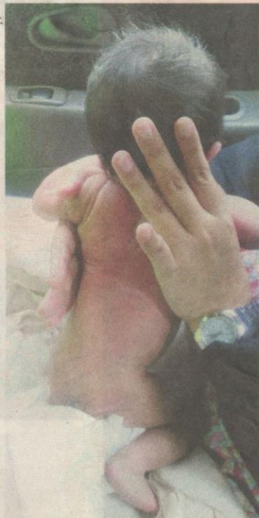
BAYI yang dilahirkan selepas terkena jangkitan virus zika bakal terencat akal dan tidak cergas.

"Analisis awal menunjukkan virus zika itu boleh disebarkan kepada janin dan janin paling berisiko diserang zika ialah ketika tempoh kehamilan tiga