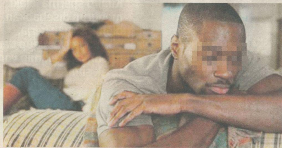
TEKANAN kerja secara berterusan menjejaskan kualiti sperma lelaki yang menaruh harapan untuk mendapat zuriat. – Gambar hiasan

Katanya, faktor penurunan kualiti sperma dalam kalangan lelaki Malaysia itu dipercayai dipengaruhi pelbagai faktor iaitu gaya hidup yang tidak sihat dan mereka banyak terdedah dengan makanan mengandungi bahan kimia.