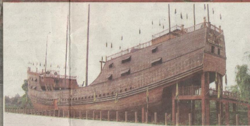
INILAH bentuk kapal yang digunakan oleh Laksamana Cheng Ho untuk menjelajah pada abad ke-15.