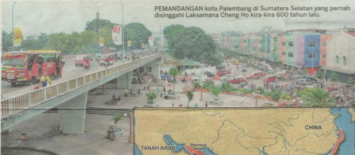
PEMANDANGAN kota Palembang di Sumatera Selatan yang pernah disinggahi Laksamana Cheng Ho kira-kira 600 tahun lalu.

tujuan kedatangannya ke Palembang sebenarnya masih samar-samar.