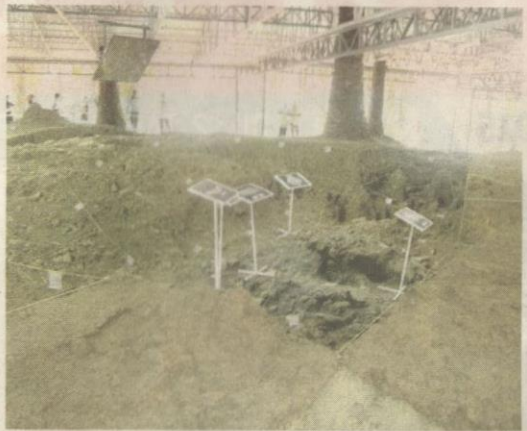
TAPAK peleburan besi tinggalan tamadun pada tahun 110 Masihi yang dijumpai penyelidik di Tapak Arkeologi Sungai Batu menunjukkan sudah wujud perkembangan teknologi besi pada waktu itu.