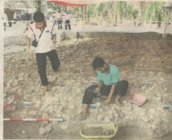
GAMBAR fail menunjukkan beberapa penyelidik menjalankan kerja-kerja mengorek artifak prasejarah di Tapak Arkeologi Sungai Batu, Sungai Petani.

"Ada di dalam sungai kuno itu lima atau tujuh kapal atau