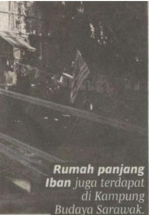
Rumah panjang Iban juga terdapat di Kampung Budaya Sarawak.