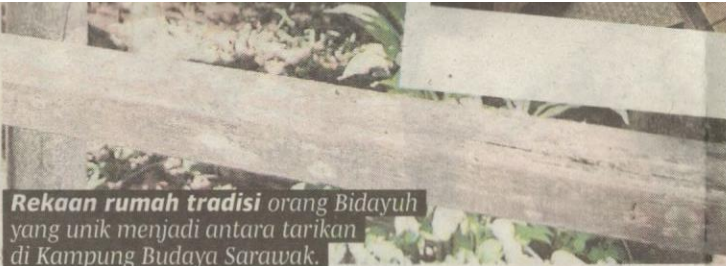
Rekaan rumah tradisi orang Bidayuh yang unik menjadi antara tarikan di Kampung Budaya Sarawak.

masuk, pengunjung akan merasai suasana kampung di tepi hutan dan tasik, terutama apabila mereka meniti jambatan buluh untuk ke 'Baruk' iaitu sebuah rumah berbentuk gasing terbalik yang menjadi pusat ritual masyarakat Bidayuh bagi upacara khas serta sambutan tradisi.