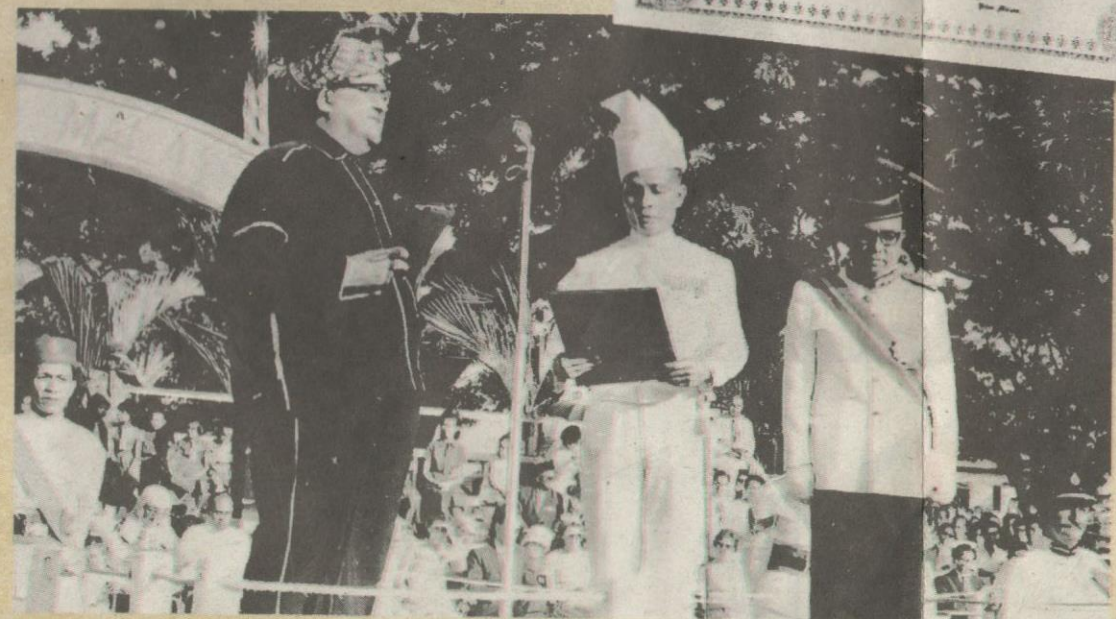
KETUA Menteri Sabah, Tun Fuad Stephens mengisytiharkan penubuhan Malaysia di Padang Merdeka, Kota Kinabalu pada 16 September 1963. Turut bersama Timbalan Perdana Menteri Tun Abdul Razak (kanan)

Jadi seharusnya kita sebagai rakyat Malaysia terutama generasi muda terhayati dan meraikan Hari Malaysia sebagai satu daripada peristiwa sejarah penting di negara kita.