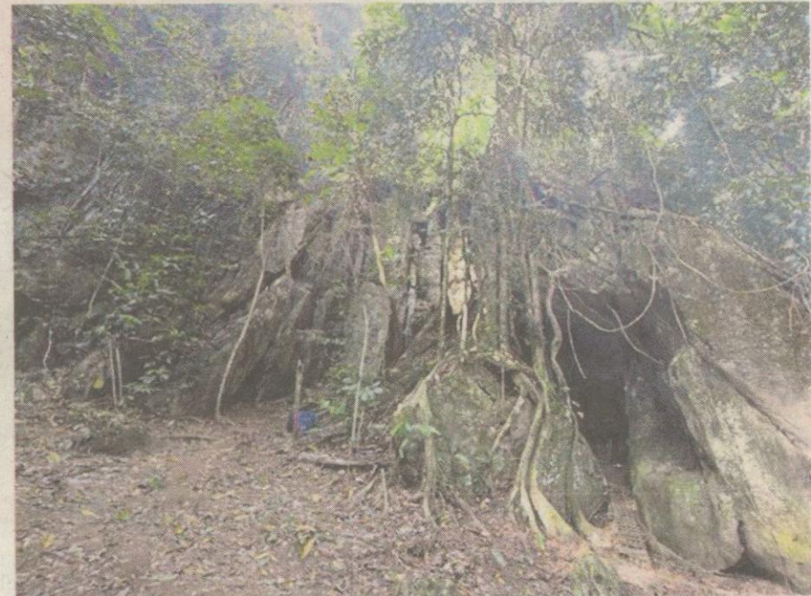
Pemandangan Gua Pelangi, Jelebu.

“Artifak itu juga dapat menggambarkan laluan kuno Paleolitik, iaitu pergerakan manusia awal ke selatan, maklumat yang selama ini ha-