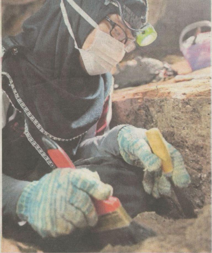
Kakitangan Pusat Penyelidikan Arkeologi Global USM melakukan kerja ekskavasi dengan teliti.

nya ditemui di utara dan timur Semenanjung. Artifak yang ditemui ialah 20 alatan batu yang dipercayai digunakan untuk memburu, memungut dan menyediakan makanan.