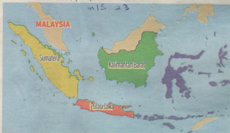
RUMAH Betang terletak di Kalimantan Barat yang masih mengekalkan identitinya sehingga ke hari ini.

“Penambahan bahagian rumah tersebut harus