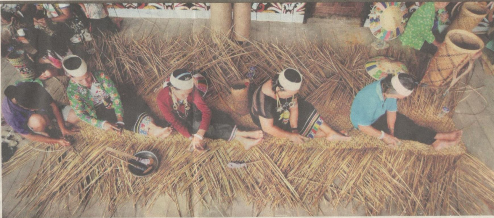
WANITA suku Dayak Kalimantan tekun menganyam tikar daripada mengkuang.