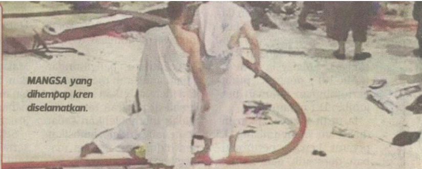
MANGSA yang dihempap kren diselamatkan.

Kira-kira 66 jemaah haji cedera, lima daripadanya serius selepas banjir kilat melanda Makkah mengakibatkan lalu lintas di Jalan Umm Al-Joud, Al-Mansour dan Al-Haj terhenti. Anggota pertahanan awam menyelamatkan 47 jemaah haji dan tujuh keluarga daripada banjir.