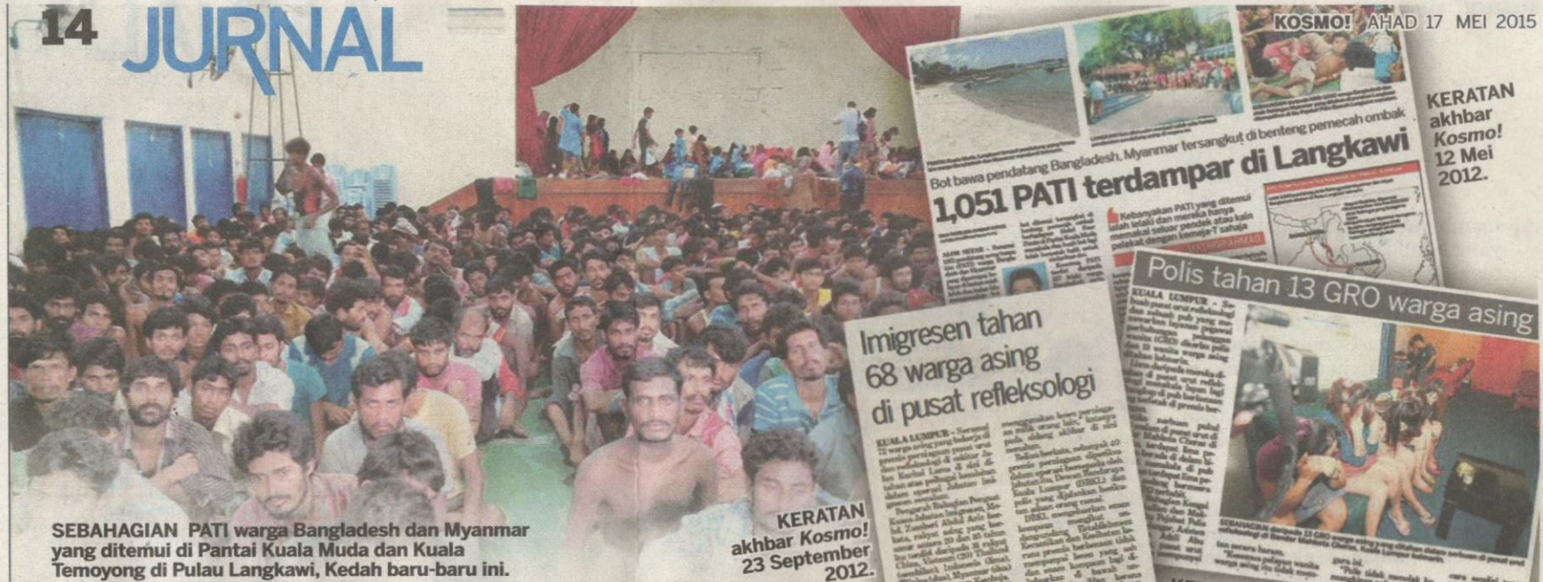
SEBAHAGIAN PATI warga Bangladesh dan Myanmar yang ditemui di Pantai Kuala Muda dan Kuala Temoyong di Pulau Langkawi, Kedah baru-baru ini.

Bot bawa pendatang Bangladesh, Myanmar tersangkut di benteng pemecah ombak 1,051 PATI terdampar di Langkawi Bot-bot kecil yang membawa pendatang dari Bangladesh dan Myanmar tersangkut di benteng pemecah ombak di Pulau Langkawi, Kedah. Akibatnya, 1,051 pendatang terdampar di pulau tersebut. Mereka kini ditempatkan di pusat-pusat deteksi dan pemrosesan di pulau itu. Kebanyakan PATI yang ditemui telah lelaki dan mereka hanya memikul saku-saku pendek atau kain pelaburan mereka? cuba