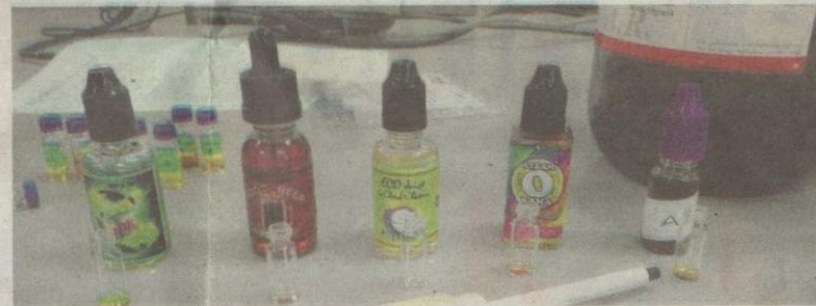
LIMA botol cecair vape yang diuji di makmal Eseri di Unisza, Kuala Terengganu. Cecair vape dikenali sebagai Tenang is Good (kanan sekali) merupakan satu-satunya perisa positif ganja.

sama ada ia digunakan di Malaysia atau tidak,” ujarnya.