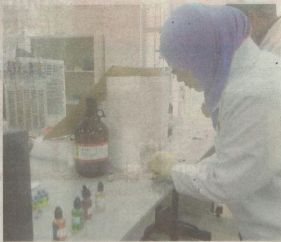
KAKITANGAN makmal Eseri melakukan ujian ke atas sampel cecair vape yang dibekalkan wartawan Kosmo!

“Hasil ujian mendapati hanya sampel perisa vape Kosmo! mengandungi dadah jenis ganja, manakala empat sampel lagi be-