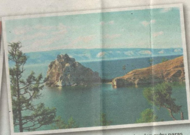
TASIK Baikal mempunyai kedalaman 1,700 meter dan suhu paras bawah 20 darjah Celsius.