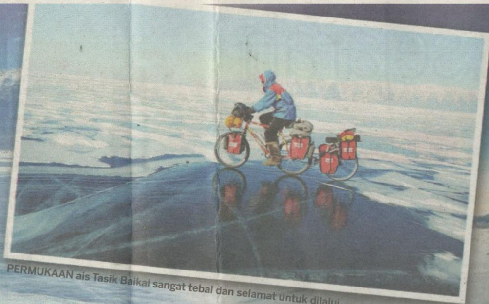
PERMUKAAN ais Tasik Baikal sangat tebal dan selamat untuk dilalui.